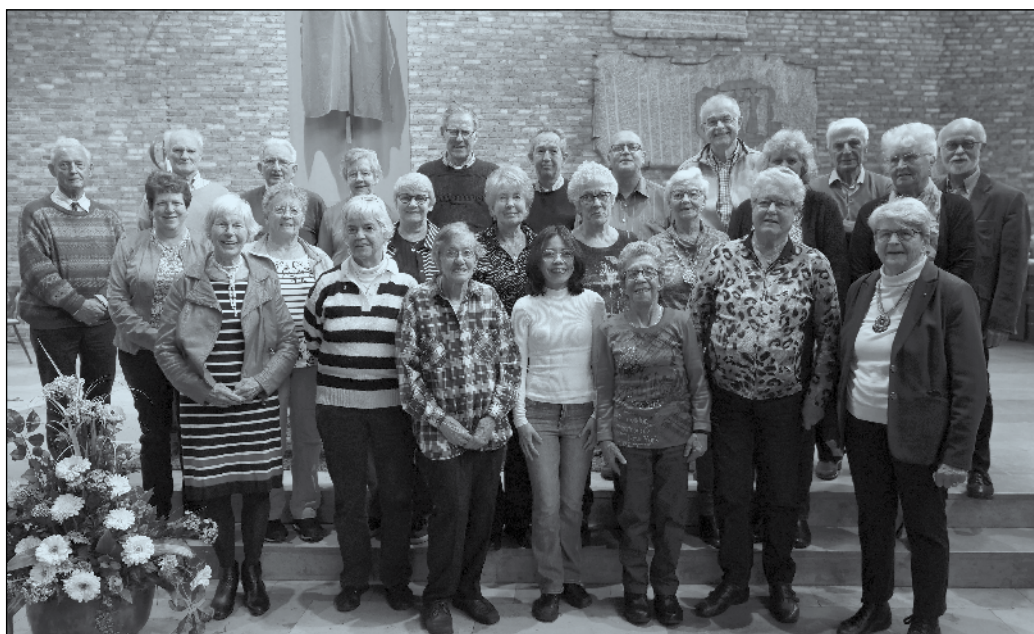
Mag de jubileumviering op 8 juni worden ervaren als een open uitnodiging naar ieder die graag wil zingen en zich wil aansluiten bij dit jubilerende Mariakoor dat vriendschap en liefde hoog in het vaandel heeft staan!

De uitstelling van het Allerheiligste vindt plaats elke eerste vrijdag van de maand in de Laurentiuskerk van 13.30 tot 15.30 uur.